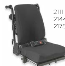
2111 + 2144 + 2175