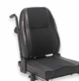
2111 + 2142 + 2173 + 2153