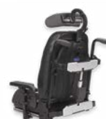
Vista posterior do Encosto Flex 3 com encosto reclinável elect.