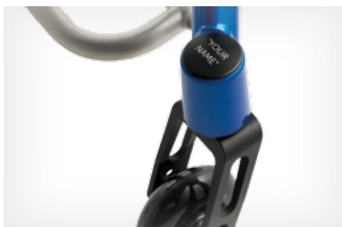
Tampa da forqueta personalizável com texto ou imagem