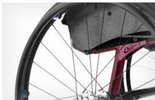
Detalhes estéticos com precisão Suíça