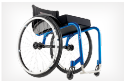
Simplemente extrema e super leve