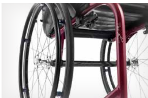
Design do chassis minimalista