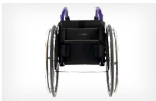
Disponível com encosto fixo ou rebatível