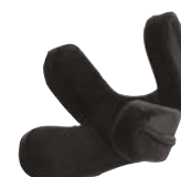
Almofada 4 pontos