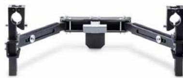
1595020 - Kit Fixação standard