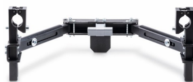
1595020 - Kit Fixação standard

* o Via GO não está equipado com travão, pelo que é recomendado que a cadeira de rodas esteja equipada com travão de acompanhante e rodas anti-volteio