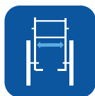
Largura do assento ▼

Para uma informação mais legível sobre este produto, incluindo o manual de utilizador, consulte por favor o site www.invacare.pt