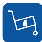
Peso de transporte ▼