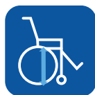
Altura do assento ▼