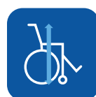
Altura total ▼