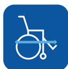
Comprimento total incluindo o apoio de pernas ▼