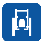
Peso total ▼