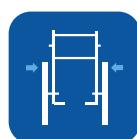
Largura total ▼