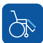
Comprimento dos apoios de pernas ▼