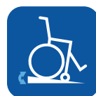
Inclinação máxima para uso do travão de parque ▼