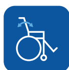
Ângulo do encosto ▼