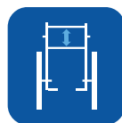
Altura do encosto ▼