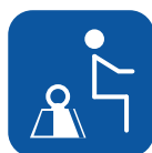
Peso max. utilizador ▼