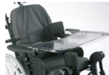
SP1570748/SP1570749 / SP1570775

Os preços recomendados ao público das opções apenas são válidos quando encomendados junto da cadeira. Quando pedidos como acessórios consulte a sua Ortopedia.