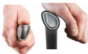
Aro Motor ergonómico Curve L (máxima eficácia na propulsão)