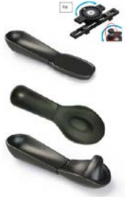
Almofada hemi com sistema de rotação 360º