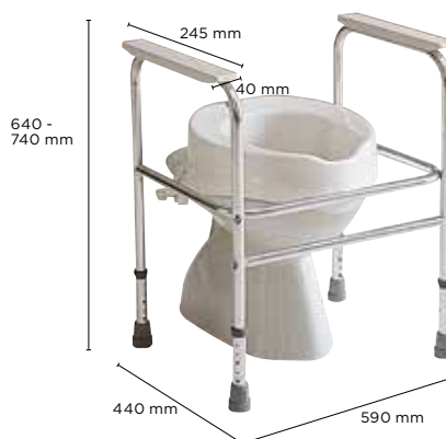
Invacare Adeo C407A

Quadro para sanita em alumínio anodizado não corrosivo.