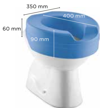
Invacare Finesse 1575061