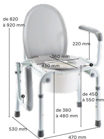
Invacare Izzo H340

Pode ser utilizada como cadeira sanitária, elevador ou quadro de sanita. Acabamento epoxy para uma alta resistência à corrosão .