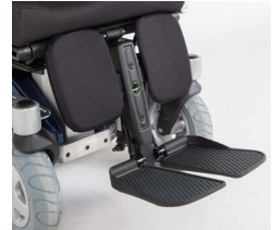
Ap. Pernas Central Elétrico LNX