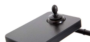
2233 + 2241