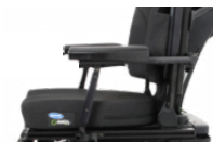
Ap. Braço Reclinável