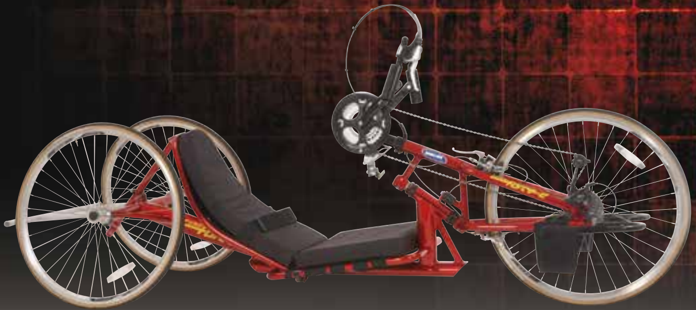
Invacare Top End Force-2